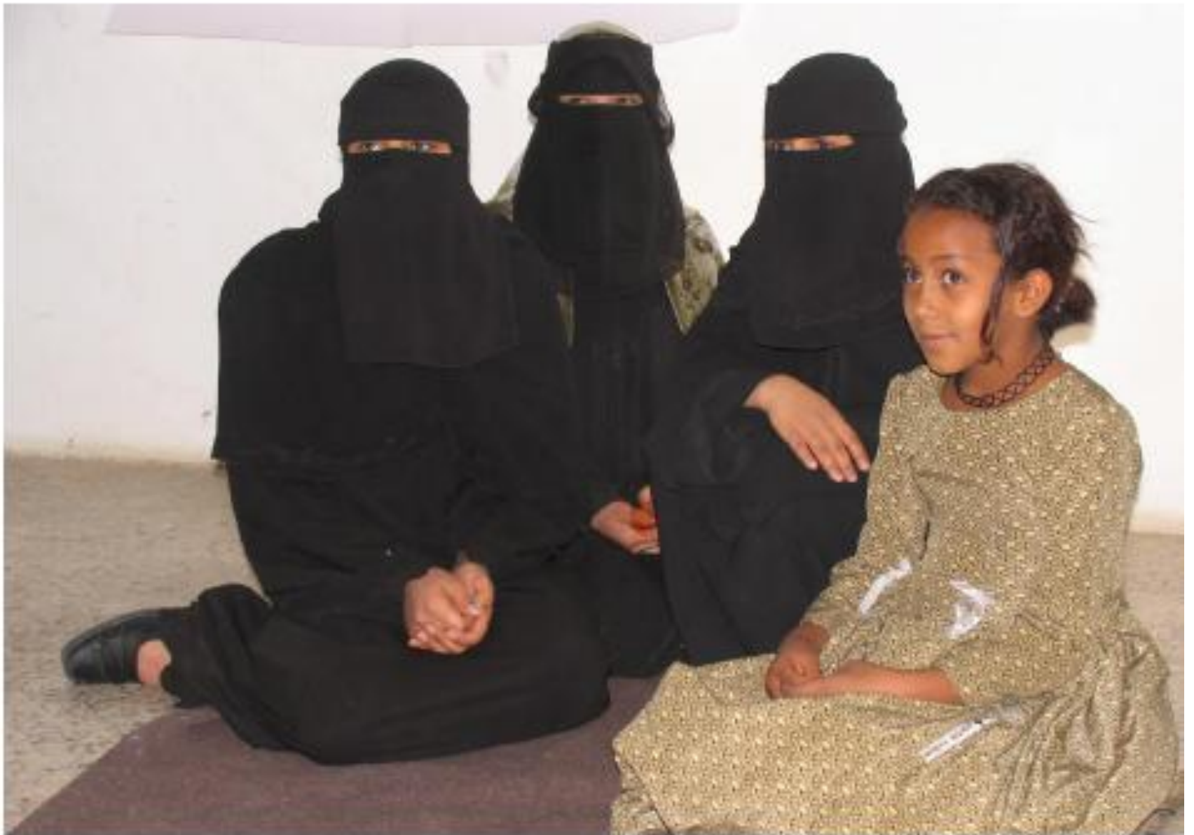
Woman or child? A crucial categorization of females in the Middle East.