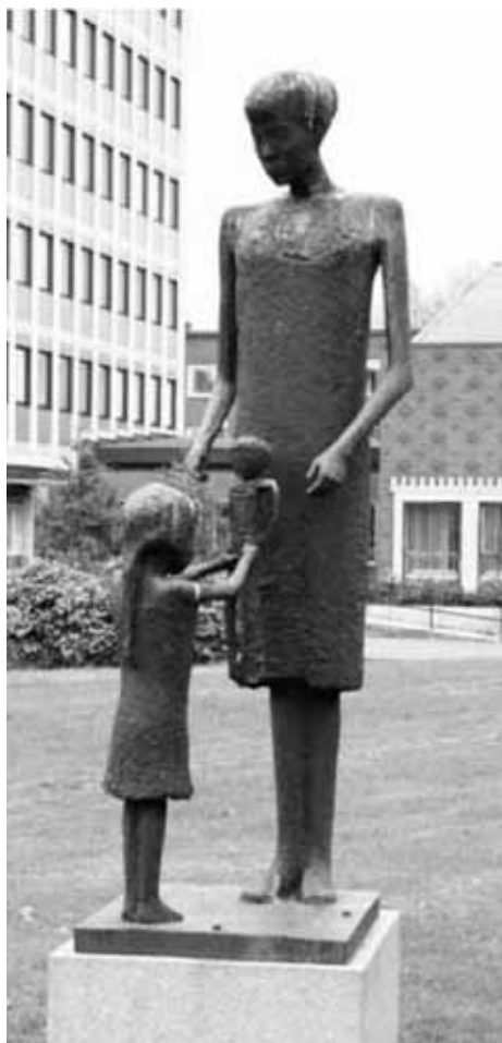
Konstnär: Asmund Arle

Om föräldern inte svarar barnet med att erbjuda trygghet då barnet upplever fara kommer det att utveckla andra beteenden som gör att det inte blir övergivet.